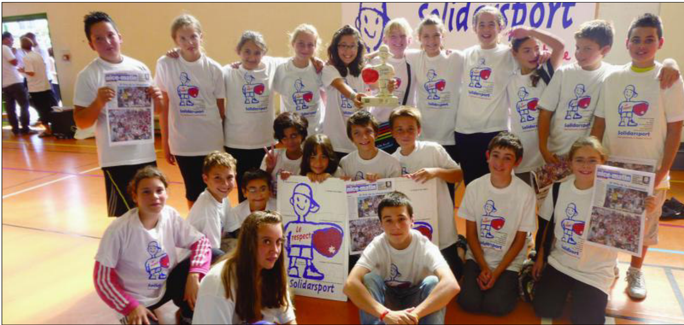
Les élèves de 3e de la classe « Réussite Pro », de Mme Locoge professeur principale, ont eu un comportement exemplaire. Ils avaient pour mission d'être les « capitaines » de leurs jeunes camarades de 6e